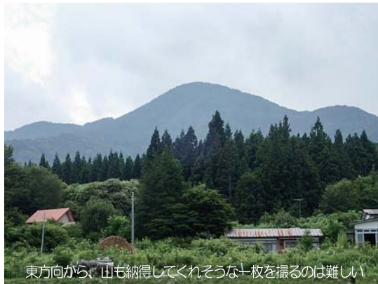
東方向から、山も納得してくれそうな一枚を撮るのは難しい