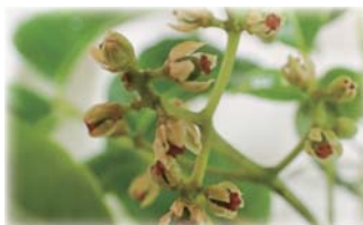
写真：網張のキハダ ▼雌花 ▼雄花 2018.6 撮影